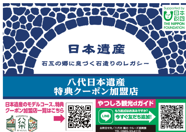
加盟店ステッカーイメージ

※特典クーポン加盟店 店舗数:33件(令和5年2月20日時点)、八代日本遺産周遊WEBサイトに掲載