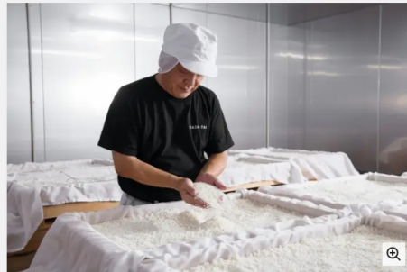
明石酒類醸造 & 海峽蒸溜所ビジターセンター（兵庫県明石市）