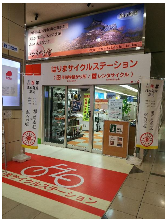
図3：サイクルステーション 外観

サイクリスト向けサービスとしては、サドル引っ掛けタイプのサイクルスタンドを設置し、簡単なメンテナンス用品の貸出しなども行っている。事前に自転車を「サイクルステーション」まで配送して預けておき、自分の自転車を運ばずに身軽に訪れることができるサービスや、手荷物の預かり（有料 500 円）なども行っている。また、男女別に各 1 室ずつ更衣室を設置。サイクリングに必要な小物類（ヘルメット、手袋など）を忘れたしまった場合、または、軽微な修理が必要となった場合でも、気軽にヘルメットや手袋、パンク修理用リペアチューブなどのサイクル用品を購入することも可能になっている。