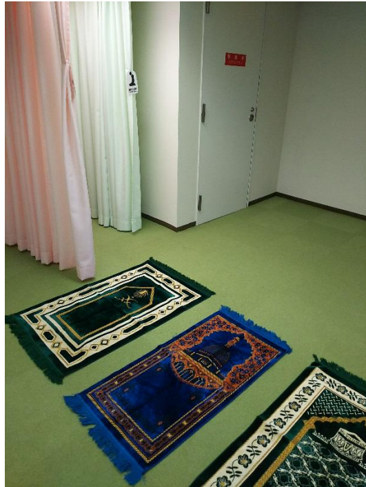
図6：ムスリム祈禱所