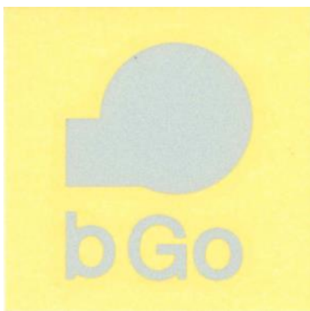
図 8 : bGo ロゴ シール

播州（播磨の別称）や自転車（bicycle,bike）の頭文字と「自転車で播州の観光地を巡ろう」というメッセージを込めている。