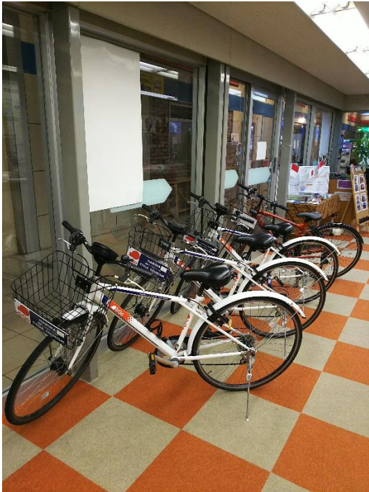
図5：レンタルクロスバイク